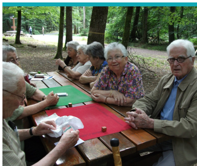
La Résidence de l'Épinière - Logement foyer