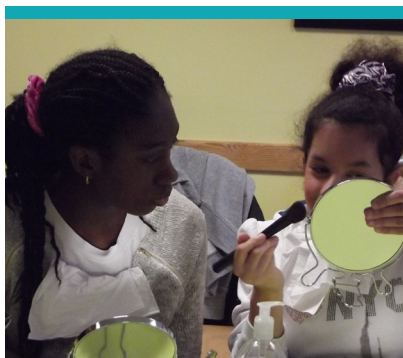
Journée maquillage et bien-être à l'EMPRO avec l'Agence du Don en Nature et Galeries Lafayette