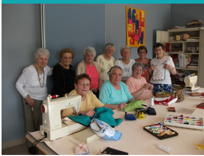
La Résidence de l'Épinière - Logement foyer