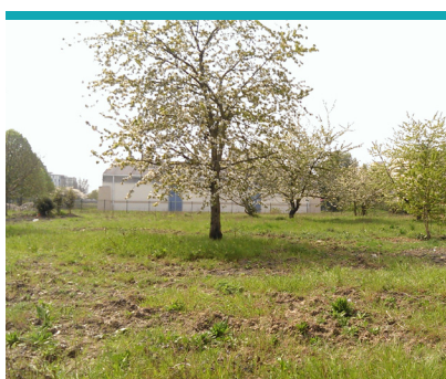
Le terrain de La Ferme des Possibles - nouveau projet de coopération du Pôle 93

Le restaurant l'Atelier sera le destinataire privilégié des productions de ce site et ses nombreux clients en seront les premiers bénéficiaires. La fréquentation de ce restaurant ne cesse d'augmenter; c'est un formidable lieu de valorisation de notre action locale. L'ensemble de nos projets et activités ont fait l'objet d'une remise d'un trophée par l'association « Plaine Commune Promotion » qui réunit les Entreprises de l'ensemble des Communes de la Communauté de Communes « Plaine Commune ».