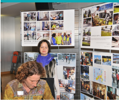
Présentation de l'ESAT Marville lors du Centenaire de l'Association