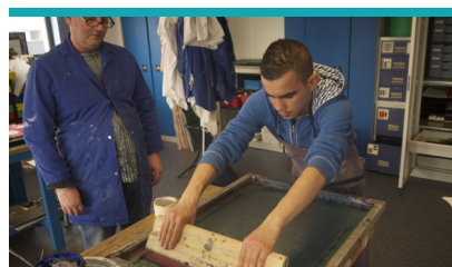
Atelier créatif - ESAT Marville