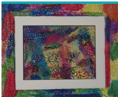
Position ON - Oeuvre exposée à l'Espace Le Soixante l'ADADA - Saint-Denis

◆ LA RÉORGANISATION ASSOCIATIVE PAR PÔLES TERRITORIAUX dont le pôle territorial de Seine-Saint-Denis qui compte désormais quatre établissements : l'ESAT Marville ; l'EMPRO ; l'ESAT Pleyel et l'IME Chaptal. Ces quatre établissements disposent d'une même direction et dans chacun des établissements ont été nommés des directeurs adjoints. L'ESAT Marville compte également un adjoint technique pour tout ce qui concerne le fonctionnement des ateliers. Ces modifications sont intervenues dans le cadre d'un redéploiement budgétaire sans augmentation de moyens.