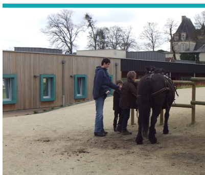
Spectacle - Inauguration du nouveau bâtiment du Pôle 49